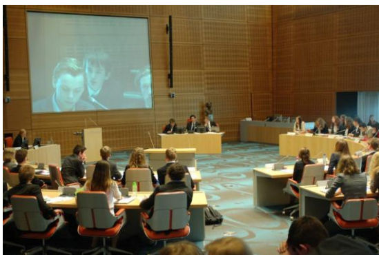
Delegatieleden in het provinciehuis van Overijssel tijdens de provinciale MEP-conferentie Overijssel.

Kijk voor meer informatie op: www.mepnederland.nl/provincialeconferentie