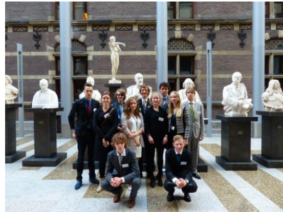
Delegatieleden en coördinator van de provincie Noord-Holland.