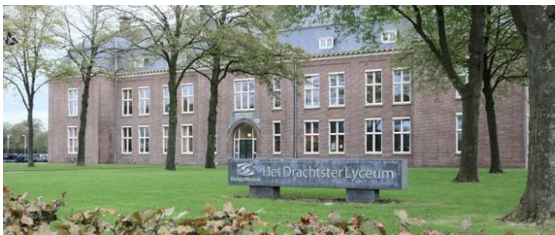
Het Drachtster Lyceum, Drachten (Friesland)