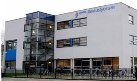
Lentiz | Reviuslyceum, Maassluis