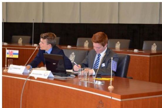
Het presidium achter de voorzitterstafel tijdens de provinciale MEP-conferentie Limburg.