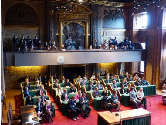
De opening in de vergaderzaal van de Eerste Kamer.