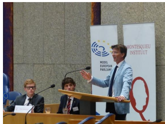
Europarlementariër Gerbrandy tijdens de sluiting.