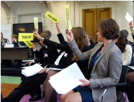
De commissie vraagt het woord.