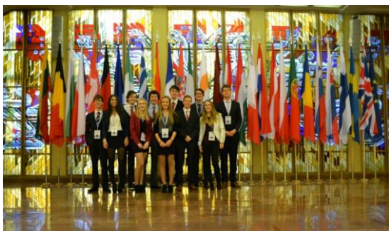
De Nederlandse deelnemers van MEP Vilnius.

Op de website is het volledige verslag geplaatst. Kijk hiervoor op: www.mepnederland.nl/vilnius