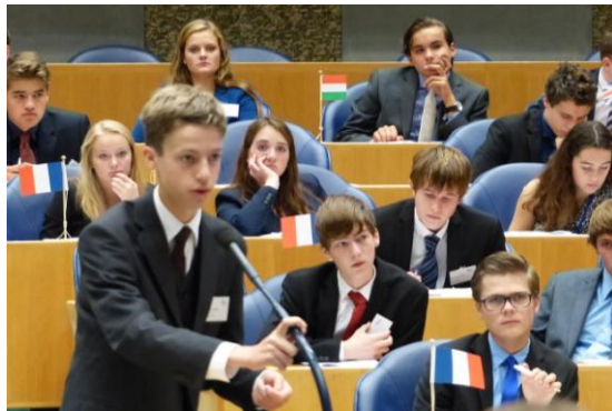
De Algemene Vergadering in de plenaire zaal van de Tweede Kamer.