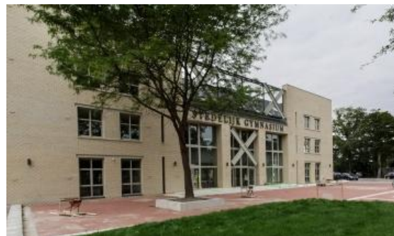
Stedelijk Gymnasium, Breda