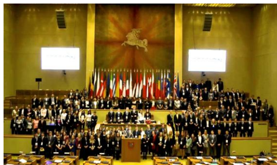
Het voltallige Model European Parliament bijeen in de Seimas, het parlamentsgebouw van Litouwen.