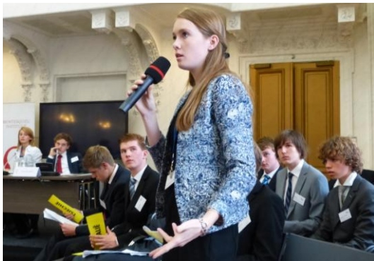
De Algemene Vergadering in de oude zaal van de Tweede Kamer.

Het vraagstuk van de schending van de democratische beginselen van de Europese Unie: bij toetreding tot de Europese Unie worden eisen gesteld aan de democratische en rechtsstatelijke kwaliteit van nieuwe lidstaten. De EU, en het lidmaatschap daarvan, veronderstelt dat alle lidstaten aan deze eisen blijven voldoen. Op welke manier moet worden ingegrepen wanneer in individuele lidstaten door nieuwe wet- en regelgeving de Europese democratische normen dreigen te worden aangetast?