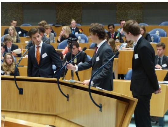
Debat in de vergaderzaal van de Tweede Kamer.