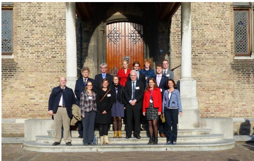
Provinciale coördinatoren en MEP-organisatoren op het Binnenhof, Den Haag