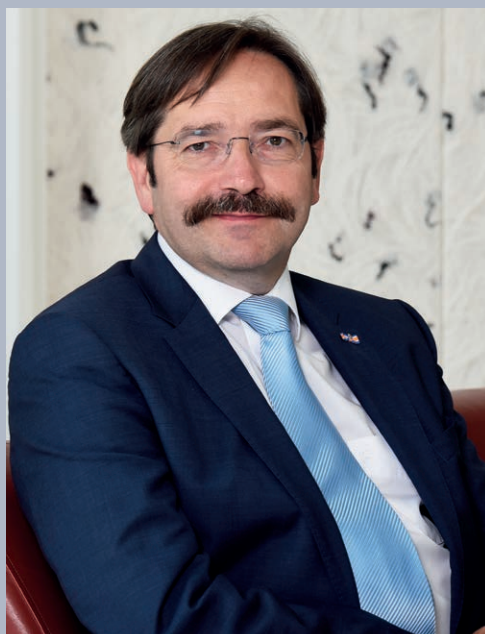
Gouverneur Theo Bovens