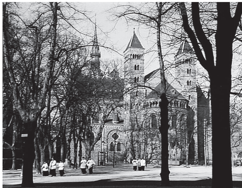
Priesters en acolieten gaan een afgestorvene tegemoet voor de begrafenis.

De combinatie van nationale wetgeving, onderwijsinspectie, sterk verbeterde onderwijzersopleidingen en de geweldige inzet van al die ontelbare religieuzen - dat alles bijelkaar heeft ervoor gezorgd dat steeds meer kinderen uit alle lagen van de bevolking konden doorleren. De intellectuele achterstand van het katholieke volksdeel kon worden ingelopen. Er ontstond zoiets als een katholieke intelligentsia. Daarmee groeide tegelijk wel de kans op scheurtjes in het front.